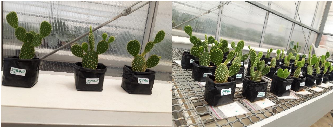
شکل ۱- نمایش از وضعیت رشد گیاهان کاکتوس اپونتیا مورد مطالعه در گلخانه.

استفاده هم‌زمان از مایکوریزا و هیومیک اسید (تیمار ۶) باعث افزایش معنادار بیش از ۳ برابری وزن تر ریشه گیاه شد به نحوی که میانگین وزن تر ریشه گیاه در تیمار شاهد از ۱/۲۱ به ۳/۴۸ گرم افزایش یافت. همچنین، استفاده هم‌زمان از هیومیک اسید و عصاره جلبک دریایی باعث افزایش وزن خشک ریشه از ۱/۲۱ در تیمار شاهد به ۲/۴۹ در تیمار ۷ (هیومیک اسید + عصاره جلبک دریایی) شد. مایه‌زنی مایکوریزا سبب افزایش وزن تر ریشه کاکتوس در تیمار ۶ شد. مایکوریزا با تولید ترکیبات شبه‌هورمونی می‌تواند سبب افزایش ریشه‌زایی گیاهان شود (Prisa and Spagnuolo, 2022). همچنین، در پژوهشی دیگر مشخص شد که کاربرد عصاره جلبک قهوه‌ای افزون بر افزایش رشد کاکتوس، سبب افزایش و گسترش جامعه میکروبی خاک نیز گردید (Prisa and Gobbino, 2021; Prisa and Spagnuolo, 2022).